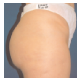
Beispiel einer DMK Celluliteüberarbeitung: nachher