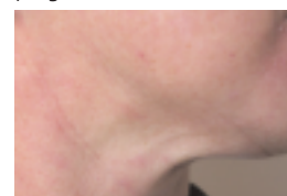
Beispiel einer DMK Halsstraffung: nachher