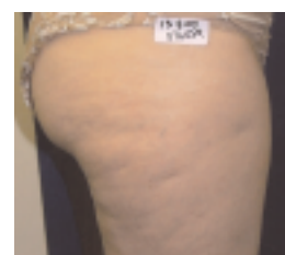
Beispiel einer DMK Celluliteüberarbeitung: vorher